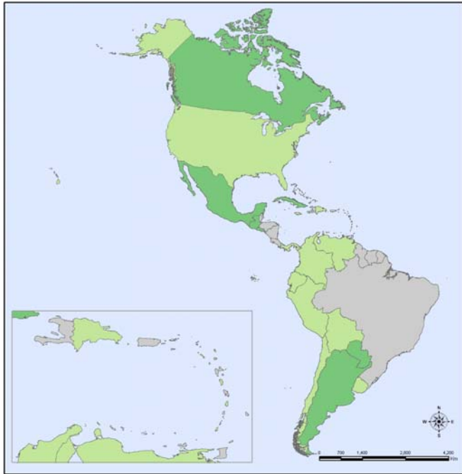
Mapa 3. Pandemia (H1N1) 2009, Intensidad de la enfermedad respiratoria aguda en la población. Región de las Américas. SE 30*.

Intensidad de la enfermedad respiratoria aguda □ Sin información disponible □ Leve o moderada □ Elevada ■ Muy elevada