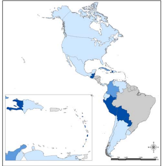
Mapa 2. Pandemia (H1N1) 2009, Tendencia del nivel de actividad respiratoria comparado a la semana previa. Región de las Américas. SE 30*.

Tendencia □ Sin información disponible □ Decreciente □ Sin cambio ■ Creciente